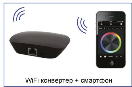
Рис.1. Схема подключения оборудования на примере контроллера SR-1009FA и диммера SR-1009CS