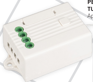
РЕЛЕЙНЫЙ МОДУЛЬ TUYA-701-WF-SUF (230V, 5A) Арт. 036221