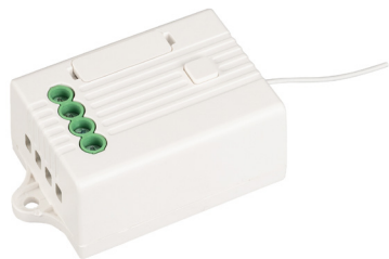
РЕЛЕЙНЫЙ МОДУЛЬ TUYA-701-WF-SUF Арт. 036221