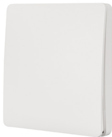
ПАНЕЛЬ TUYA-228-1-RF-SUF Арт. 033667