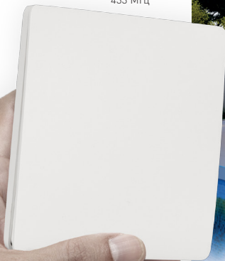
ПАНЕЛЬ TUYA-228-1-RF-SUF Арт. 033667