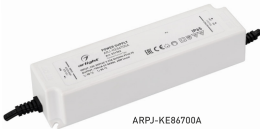
ARPJ-KE86700A ARPJ-KE571050A ARPJ-KE421400A