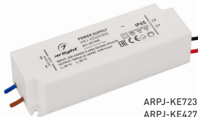
ARPJ-KE72350A ARPJ-KE42700A ARPJ-KE60700A ARPJ-KE401050A