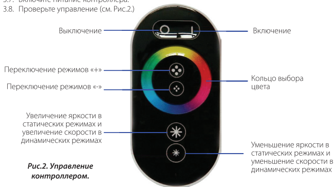
Рис.2. Управление контроллером.