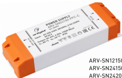
ARV-SN12150-PFC-C ARV-SN24150-PFC-C ARV-SN24200-PFC-C