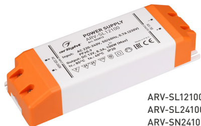
ARV-SL12100 ARV-SL24100 ARV-SN24100-PFC-C