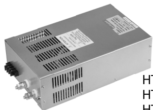
HTS-1500-12 HTS-1500-24 HTS-1500-48

В металлическом кожухе УЛЬТРАМОЩНЫЕ С вентилятором