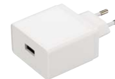
023248 ARDV-24-5V-USB FAST