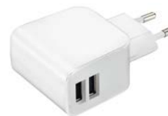
023249 ARDV-16-5V-USB DUO