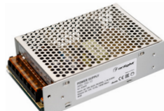
ARS-150 ARS-200 ARS-250