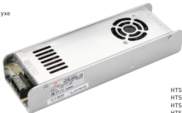
HTS-300L-12 HTS-300L-24 HTS-400L-12 HTS-400L-24