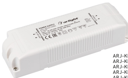
ARJ-KE70700 ARJ-KE86700 ARJ-KE481050 ARJ-KE571050 ARJ-KE301400 ARJ-KE361400 ARJ-KE421400A