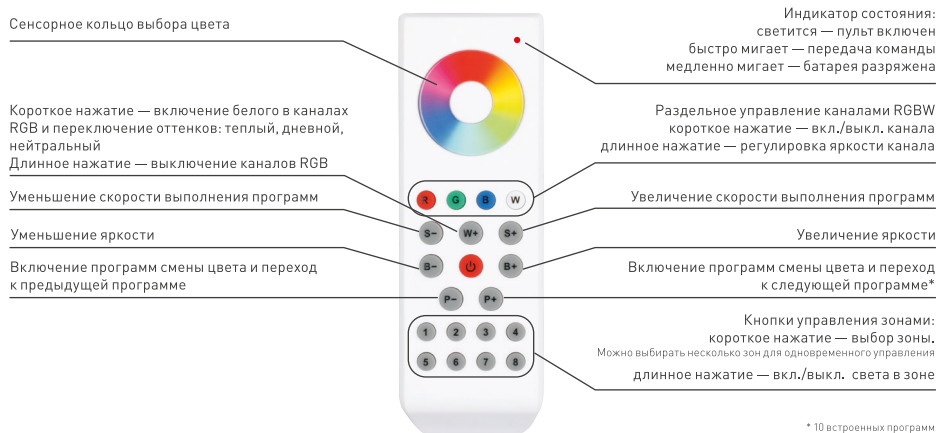
Рисунок 1. Функции пульта.

⚠ ВНИМАНИЕ! Во избежание поражения электрическим током перед началом всех работ отключите электропитание. Все работы должны проводиться только квалифицированным специалистом.