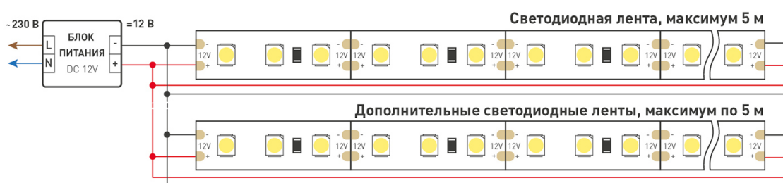
Схема 2. Подключение нескольких светодиодных лент с двух сторон.

Рекомендуется использовать для обеспечения равномерного свечения ленты по всей длине.