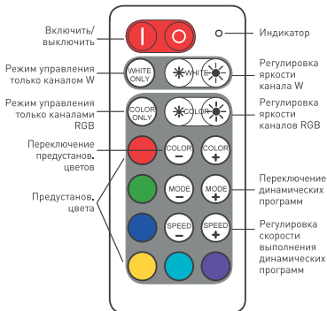
Рисунок 2. Назначение кнопок пульта ДУ.

отпустите их через 3 секунды. Трехкратное мигание светодиодного индикатора на контроллере зеленым цветом подтвердит успешную привязку пульта. В случае срабатывания защиты светодиодный индикатор на контроллере может светиться разным цветом: мигающий красный — защита от перегрузки или короткого замыкания, мигающий желтый — защита от перегрева. Устраните причину срабатывания защиты, и через некоторое время контроллер вернется в рабочий режим.