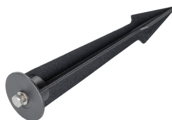
Рисунок 3. Основание для установки в грунт (арт. 024889).