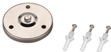
Рисунок 1. Основание для установки на поверхность (ALT-BASE-R75, арт. 024890).