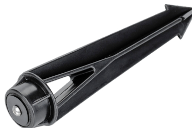
Рисунок 2. Основание для установки в грунт (ALT-SPIKE-175, арт. 024888).