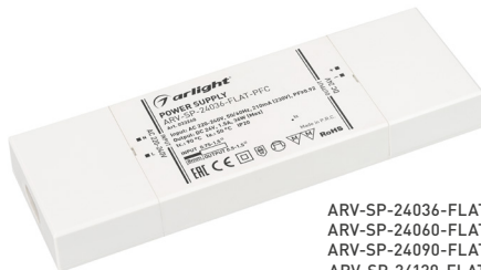
ARV-SP-24036-FLAT-PFC ARV-SP-24060-FLAT-PFC ARV-SP-24090-FLAT-PFC ARV-SP-24120-FLAT-PFC