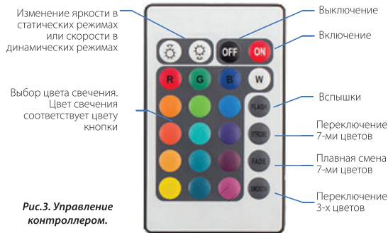
Рис.3. Управление контроллером.